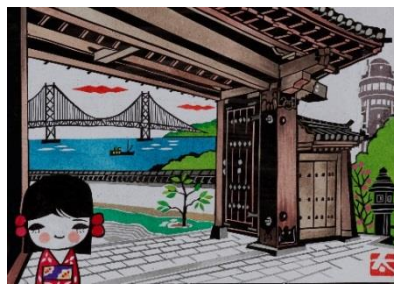
伊藤 太一「時の道の古寺」