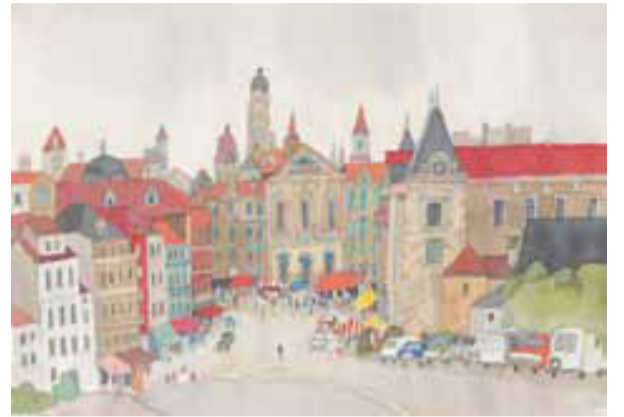
安野光雅「ポルトの町並み」©空想工房

1926年、島根県津和野町に生まれた安野光雅は、子供の頃より画家になる夢を抱き、美術教師として上京します。教員のかたわら、本の装丁など出版関係の仕事を手掛け、1968年、「ふしぎなえ」で絵本界にデビュー。美術だけでなく科学や数学にも造詣が深く、持ち前の好奇心と想像力の豊かさを発揮し、次々と独創性に富んだ作品を発表し続けています。国際アンデルセン賞画家賞をはじめ数々の賞を受賞し、2012年には文化功労者となりました。本展では津和野町立安野光雅美術館所蔵の絵本原画や歴史画、風景画などの代表作を展示し、画家・安野光雅の世界をお楽しみいただけます。